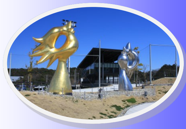
岡本太郎氏作「であい」