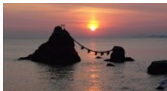
(夏至の頃の二見浦)